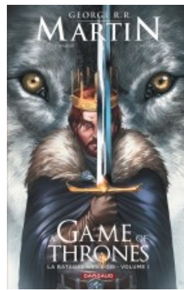
A Game of Thrones - La Bataille des rois - tome 1