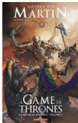
A game of thrones - La bataille des rois - Tome 2