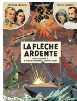
La Flèche ardente