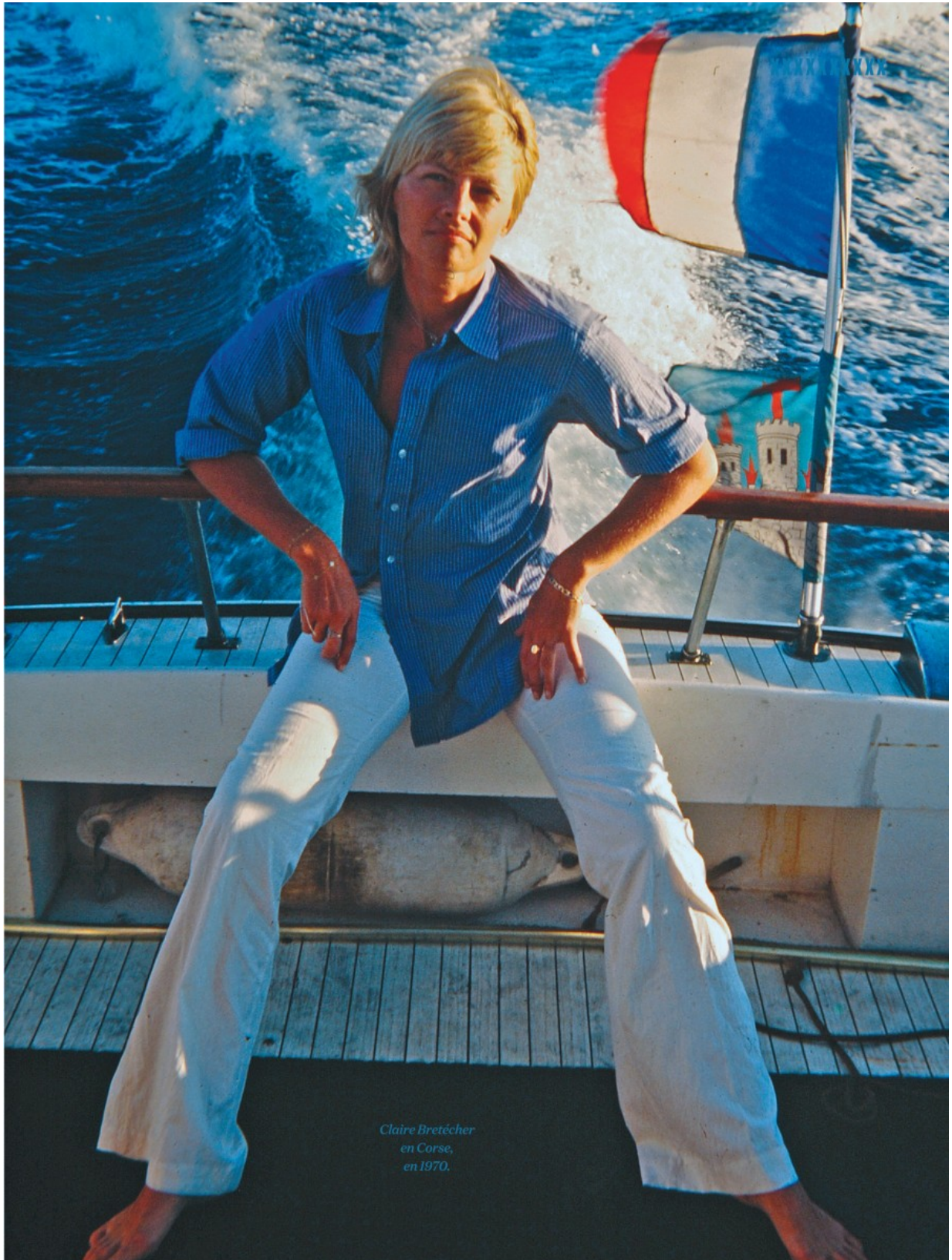
Claire Bretécher en Corse, en 1970.