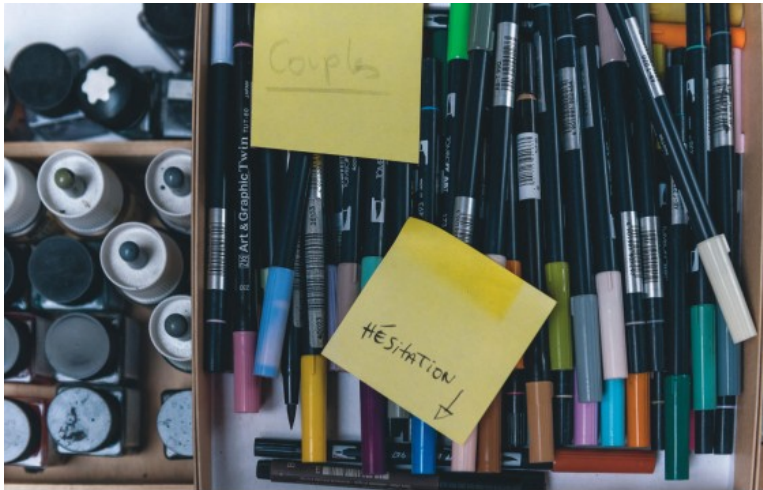
« Hésitation » : sur un Post-it laissé là par l'artiste, on lit le doute qui l'anima.