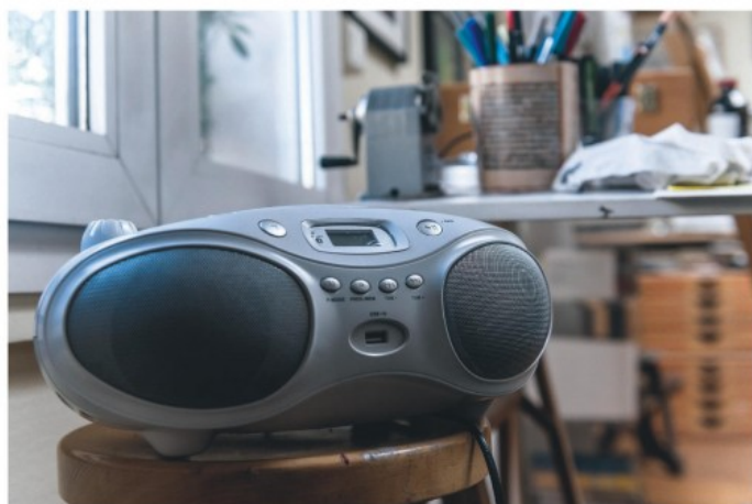
Un lecteur de CD qui ressemble à un alien, pour dessiner en musique (voir ci-contre).

Les citations de Claire Bretécher sont extraites de « Circus » (1977), de « Libération » (1998), de « Paris Match » (2004), d'un documentaire de France 5 (2008), du « Nouvel Observateur » (2009), du « Parisien » (2009), de « L'Express » (2009), de « Lire » (2011).