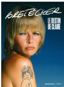
Bretécher - Le destin de Claire