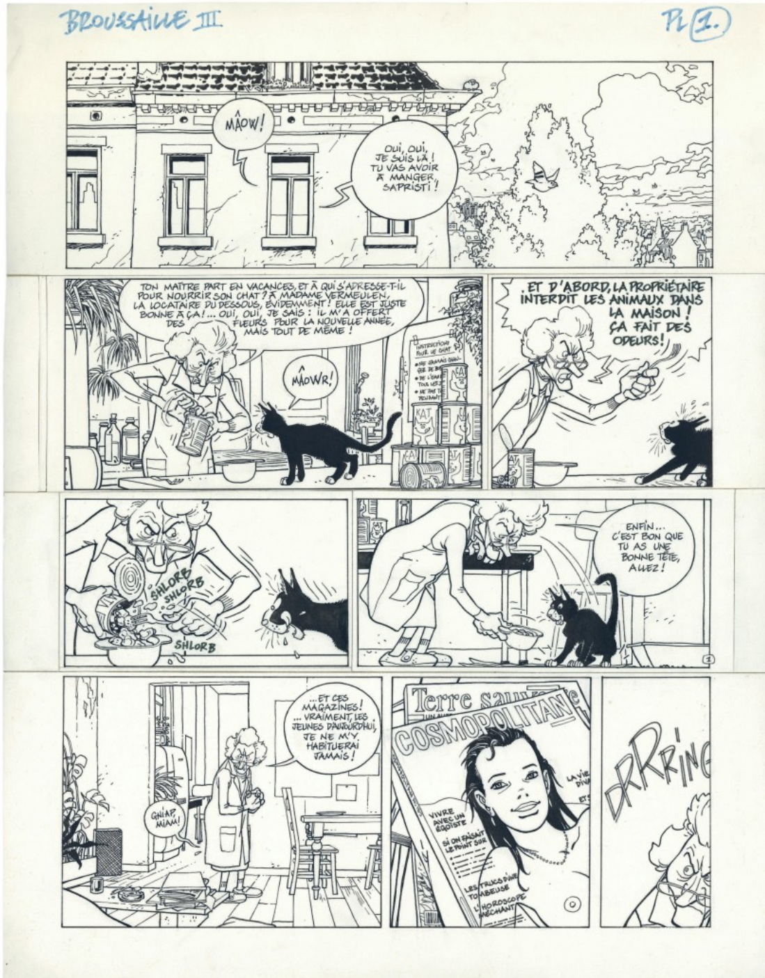
Premières planches d'une nouvelle aventure de Broussaille, abandonnée au profit de La nuit du chat .