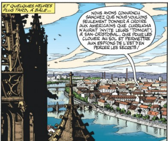
ET QUELQUES HEURES PLUS TARD, À BAËLE...

GÉNIAL DE L'AVOIR PERSUADÉ QUE NOUS VOULIONS SEULEMENT RIDICULI- SER LES AMÉRICAINS POUR LES BROUILLER AVEC CURRUCHA!