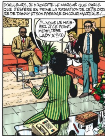
③ Voir dans la même série tous les albums où intervient Lady X.