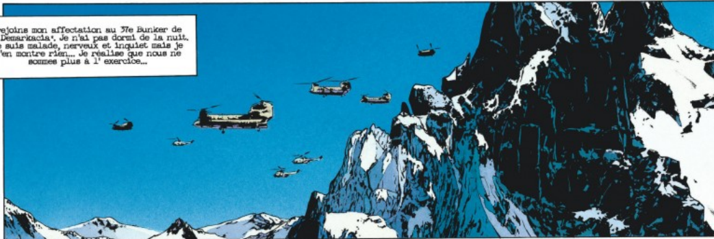
* LIGNE DE FRONT