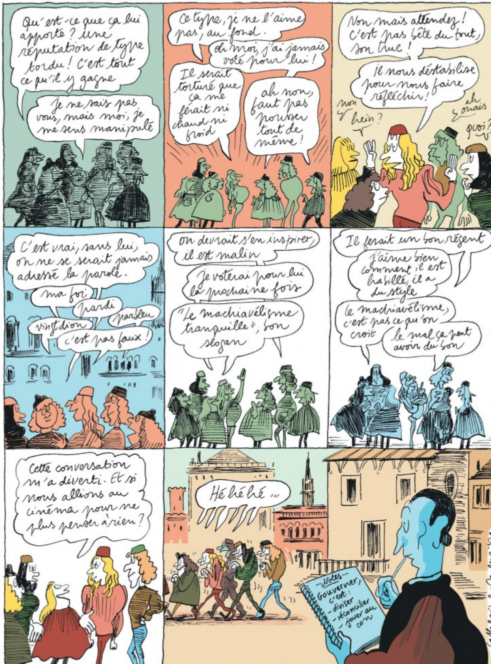
Nicolas Machiavel, écrivain et homme politique, 1469-1527

L'auteur du Prince n'est pas le seul penseur à voir son nom transformé en adjectif sensiblement éloigné de ses écrits ; nul goût pour le mal, mais un souci de réalisme qui conduit en effet à séparer la politique et la morale. La « vérité effective des choses » exclut tout angélisme quand on veut bien gouverner.