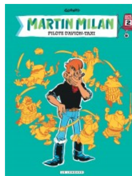
Intégrale Martin Milan 2