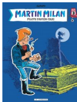
Intégrale Martin Milan 3