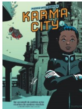
Karma City 1/2