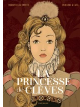
La Princesse de Clèves