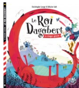
Le Roi Dagobert et le dragon gascon