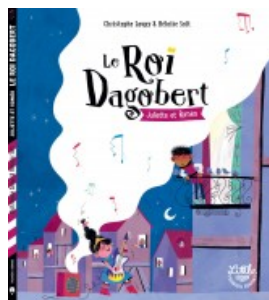
Le roi Dagobert : Juliette & Roméo