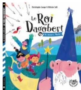
Le roi Dagobert : Au secours Merlin !