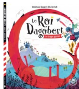
Le Roi Dagobert et le dragon gascon