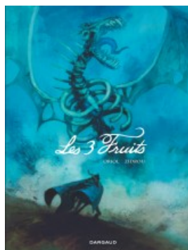
Les 3 Fruits