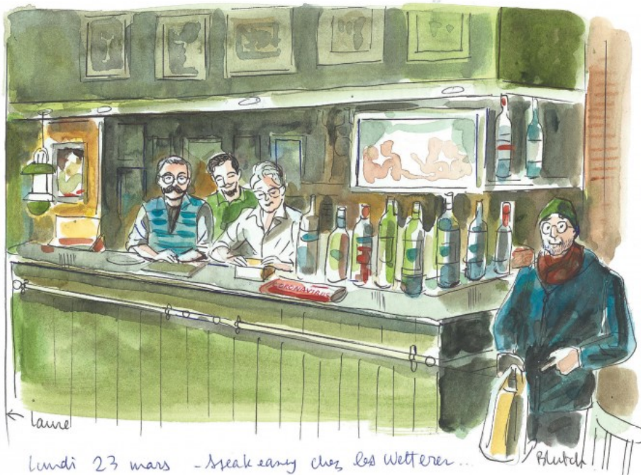
lundi 23 mars - speak easy chez les Welterer...