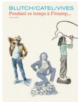
Pendant ce temps à Fécamp...