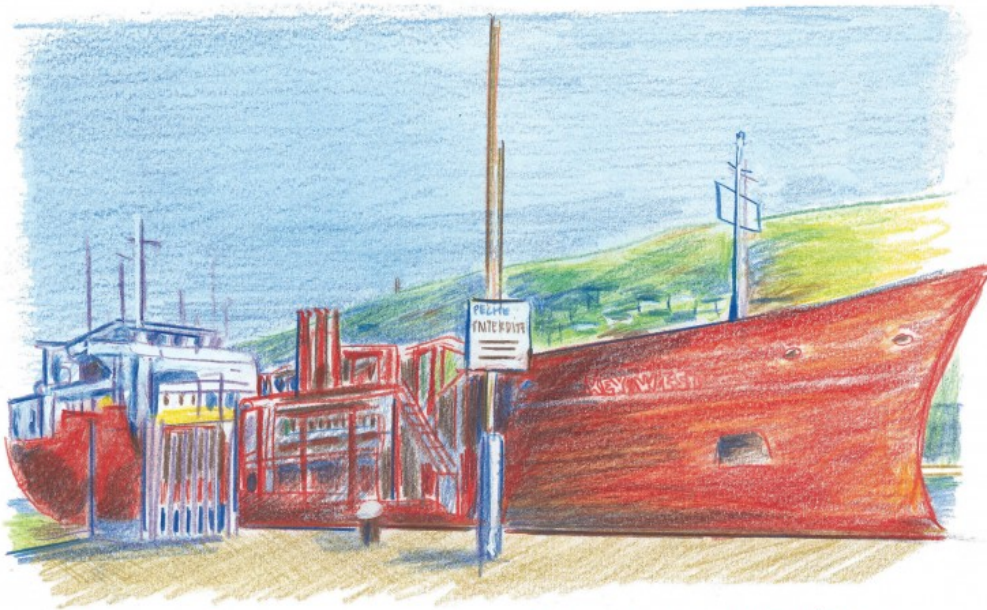
Dimanche 15 mars : annonce de confinement général, tous dans le même bateau!