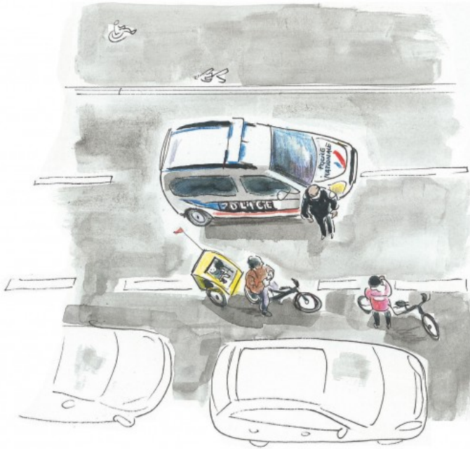
Dimanche 22 mars : les Vives se font arrêter sous nos yeux à bicyclette!