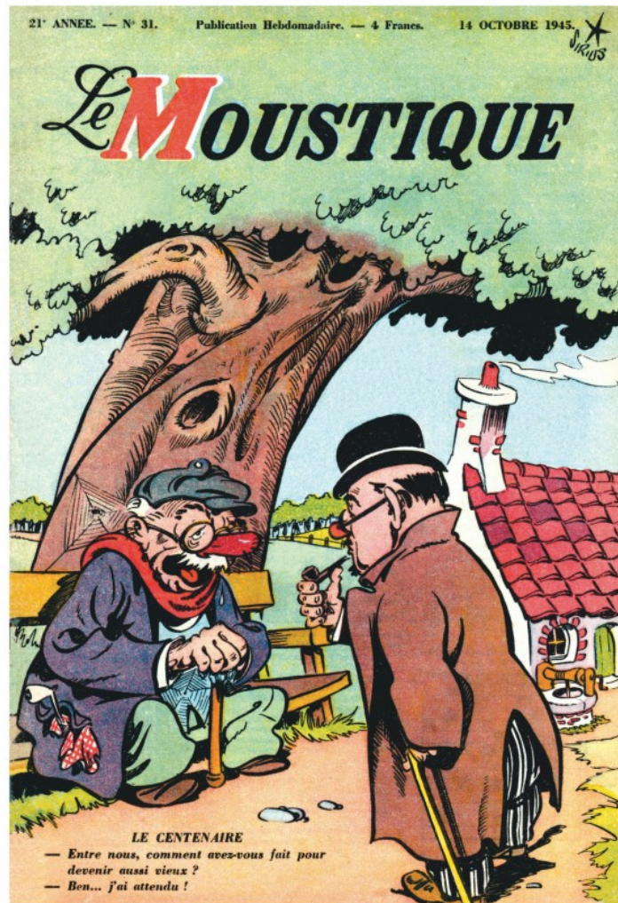
Sirius 14 octobre 1945

Tandis que Sirius est surtout passé à la postérité pour la veine réaliste de son travail avec «Timour», «L'Épervier bleu» et «Godefroid de Bouillon», ses dessins pour Le Moustique révèlent un authentique humoriste.