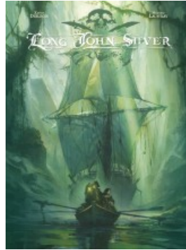
Long John Silver intégrale - tome 2