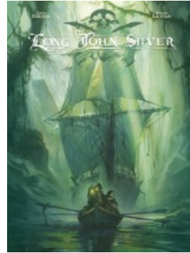
Long John Silver intégrale - tome 2