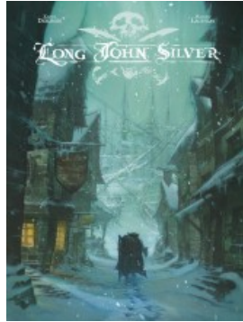
Long John Silver intégrale - tome 1