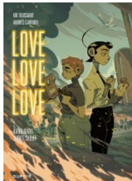
Bang bang shoot shoot