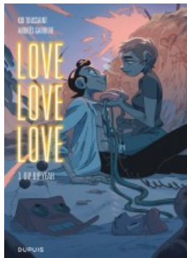
Bip bip yeah