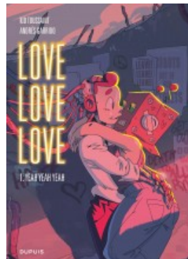
Yeah yeah yeah