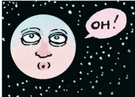
La Lune telle qu'elle apparaît dans L'Histoire du conteur électrique qui est à l'origine du titre de la monographie L'Histoire d'un conteur éclectique.