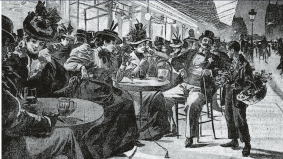
Illustration de Georges Redon pour le Gil Blas (juin 1896) à l'occasion de l'ouverture de la brasserie Mollard.

à leurs envies et d'apporter une sérieuse dose d'humour et de folie à leurs créations. Devenu célèbre grâce aux Monty Python puis à ses réalisations en solo, – qui n'a pas vu Sacré Graal , La Vie de Brian , Brazil ? – Gilliam a su étonner, dérouter, surprendre, à l'instar de Fred dans son propre domaine d'expression.