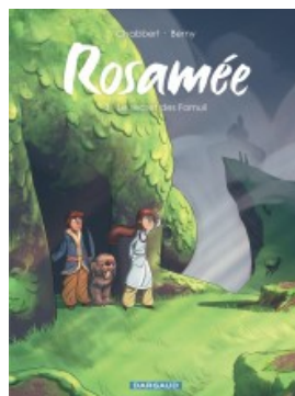
Le secret des Famuli