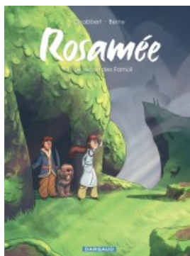
Le secret des Famuli