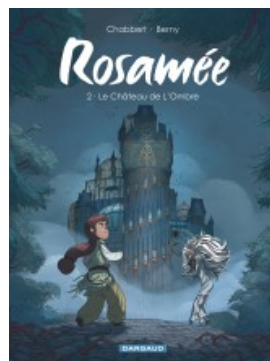
Le Château de L'Ombre