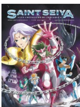
Saint Seiya - Time Odyssey T2