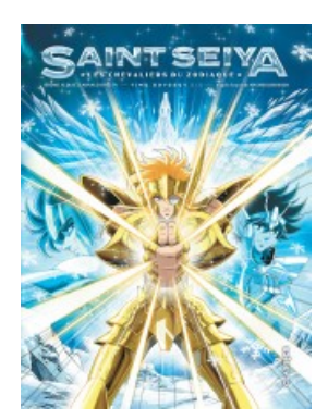
Saint Seiya - Time Odyssey