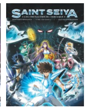
Saint Seiya - Time Odyssey T1