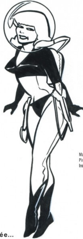
Mai 1980. Pin-up de l'espace. Inédit.

À ce point du récit, il convient d'aller rechercher un vieux concept autrefois utilisé en analyse littéraire. Il faut parler de la théorie de l'innutrition, c'est-à-dire de ce dont se nourrit tout artiste, de l'inspiration plus ou moins consciente qu'il puise dans la culture dont il s'est imprégné. « Il est bon que certaines œuvres vous hantent », reconnaissait Cocteau. Alors, en ce sens, Clerc est un individu hanté. Hanté de dessinateurs, de romans, de BD, de films et de musiques. Dis-moi ce que tu vois, ce que tu lis, ce que tu écoutes, et je te dirai qui tu es.