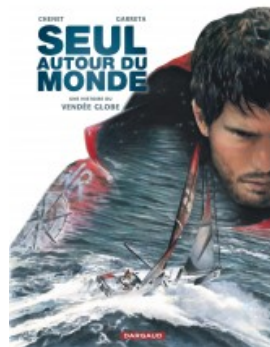
Seul autour du monde