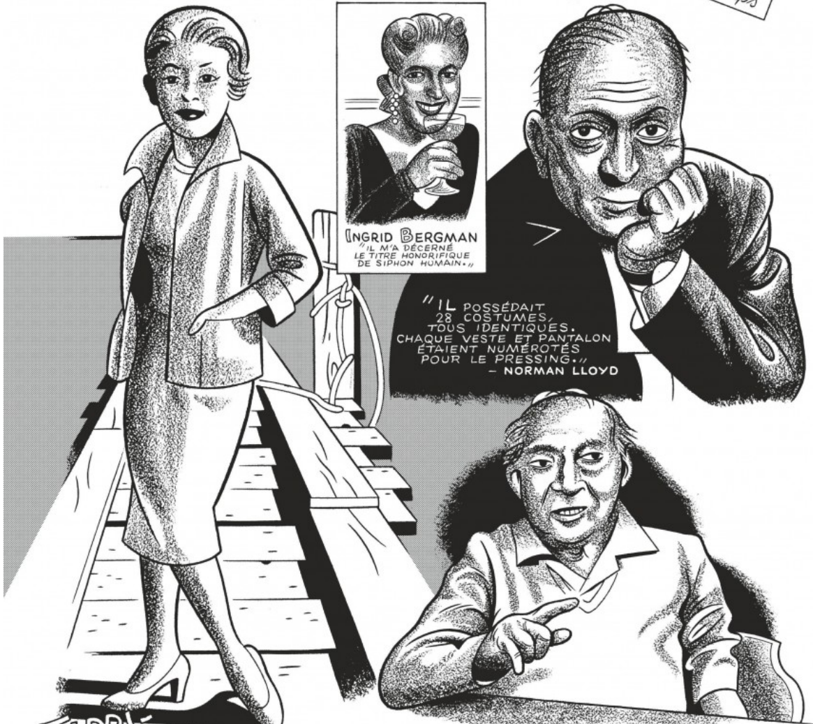
INGRID BERGMAN "IL M'A DÉCERNÉ LE TITRE HONORIFIQUE DE SIPHON HUMAIN."

"IL POSSÉDAIT 28 COSTUMES, TOUS IDENTIQUES. CHAQUE VESTE ET PANTALON ÉTAIENT NUMÉROTÉS POUR LE PRESSING." - NORMAN LLOYD