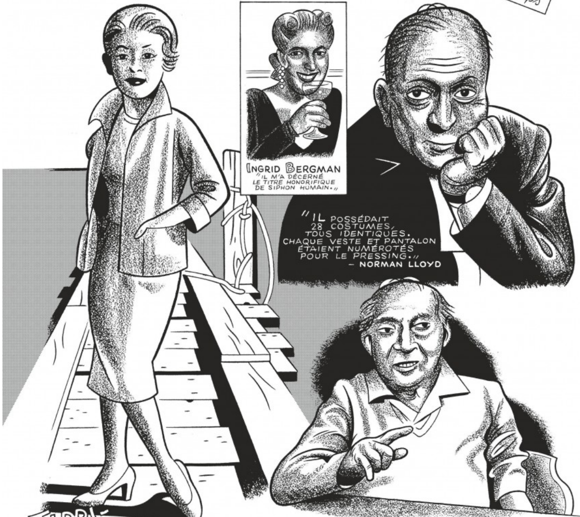
INGRID BERGMAN "IL M'A DÉCERNÉ LE TITRE HONORIFIQUE DE SIPHON HUMAIN."

"IL POSSÉDAIT 28 COSTUMES, TOUS IDENTIQUES. CHAQUE VESTE ET PANTALON ÉTAIENT NUMÉROTÉS POUR LE PRESSING." - NORMAN LLOYD