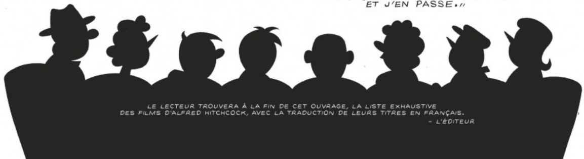
CHARLES BENNETT "INUTILE DE S'ÉTENDRE SUR LE DÉCLIN DE HITCH. L'ÉROSION PROGRESSIVE DE SON TALENT, SON ALCOOLISME DÉSPÉRÉ SUR LE TARD, LES SECRÉTAIRES QU'IL POURSUIVAIT DANS SES PROPRES BUREAUX, ET J'EN PASSE."

LE LECTEUR TROUVERA À LA FIN DE CET OUVRAGE, LA LISTE EXHAUSTIVE DES FILMS D'ALFRED HITCHCOCK, AVEC LA TRADUCTION DE LEURS TITRES EN FRANÇAIS. - L'ÉDITEUR