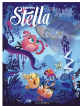
La Méchante princesse du haut château