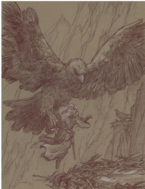
GANDALF ET LE ROI DES AIGLES

2009, 35 X 28 CM, CRAYON AQUARELLE ET FUSAIN SUR PAPIER TEXTURÉ.