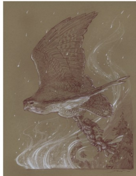
DE CHARYBDE EN SCYLLA, CROQUIS

2009, 35 X 28 CM, CRAYON AQUARELLE ET FUSAIN SUR PAPIER TEXTURÉ.