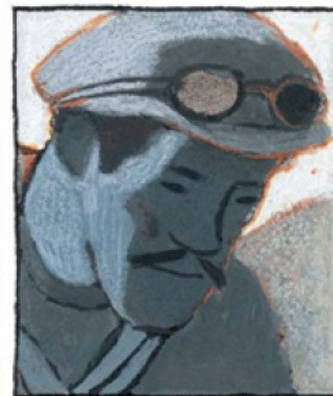
IL Y A AUSSI GODARD L'ALGÉROIS...