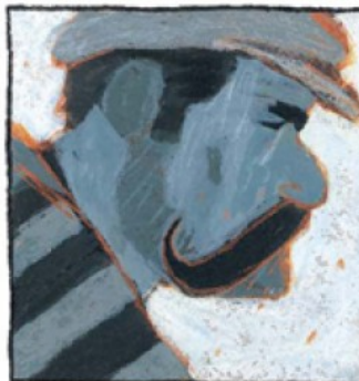
AUCOUTURIER, DIT «LE TERRIBLE», IDENTIFIABLE À SA MOUSTACHE EN GUIDON DE VÉLO...