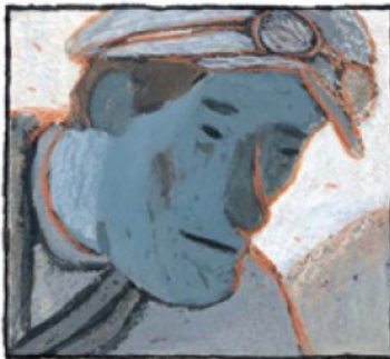
ET PUIS IL Y A HENRI CORNET, DIT «RIGOLO», QUI TRIOMPHA EN 1904 À L'ÂGE DE VINGT ANS ET COURT CETTE ANNÉE POUR LE GLOBE...