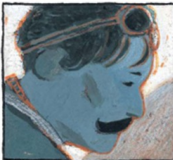
«TROU-TROU» TROUSSELIER, LE MÔME DE LEVALLOIS, VAINQUEUR DU TOUR 1905 APRÈS AVOIR ARRACHÉ CINQ ÉTAPES...