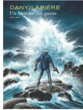
Un homme qui passe