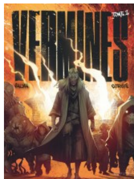
Vermine tome 2